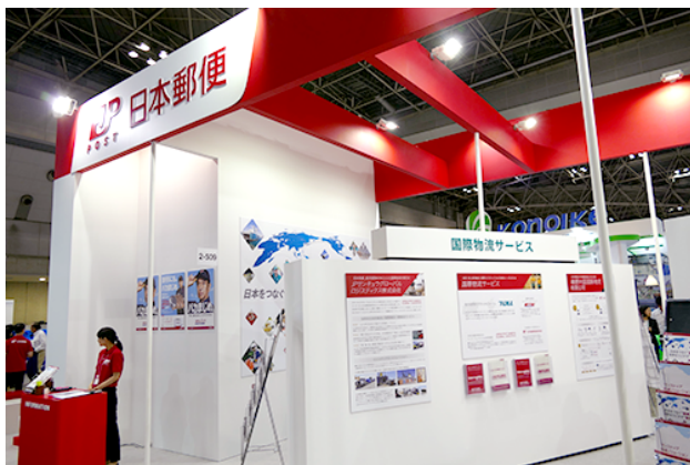
日本郵便の物流サービスをパネルで視覚的に PR